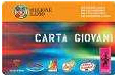
E' arrivata la carta giovani della Regione Lazio dai 14 ai 25

a) l'uso gratuito dei mezzi pubblici regionali nell'area extraurbana nei giorni di venerdì e sabato dalle ore 19.00 e fino alle ore 07.00 del giorno successivo; b) l'accesso a tariffe ridotte nei musei di interesse regionale e locale, nonché alle iniziative e manifestazioni culturali, musicali e sportive promosse o finanziate dalla Regione Lazio direttamente o mediante il trasferimento di fondi regionali agli enti locali (è previsto uno sconto del 20% su tutte le iniziative culturali inserite nel circuito regionale teatrale e musicale); c) convenzioni con alberghi e ostelli della gioventù per favorire la permanenza nei luoghi ove i giovani intendono recarsi durante il fine settimana; d) altre agevolazioni finalizzate a so-